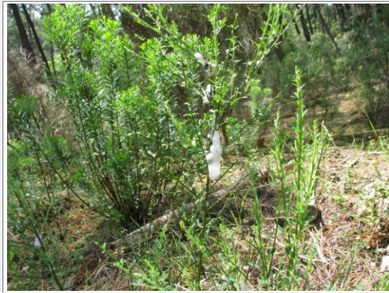
Cocon pour larve