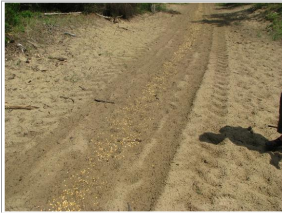
agrainage de maïs: nourrissage de sangliers

On arrive au but de notre visite, quelle surprise Notre Dame de BUZE n'est en fait qu'une grosse dune habillée d'arbres et arbustes avec une pancarte usée par le soleil et le temps rappelant que sous ce sable, une chapelle est ensevelie depuis le XVIème siècle.