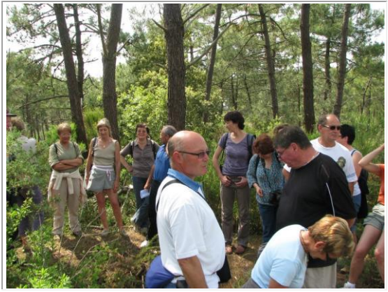
sous nos pieds, la Chapelle