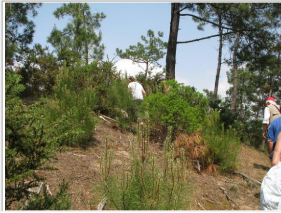
le sommet au dessus de ce que fut le toit...