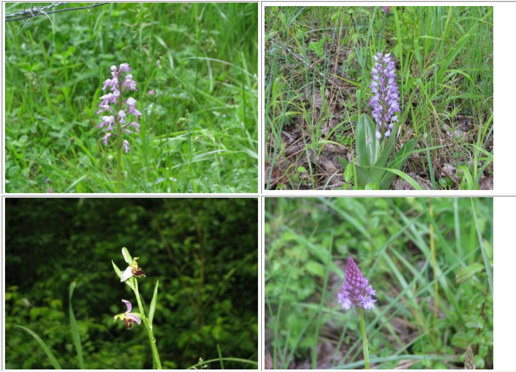
orchidées (6 variétés différentes observées)

En vérité, c'était bien elles qui nous ont fait braver la pluie, cela en valait la peine ! Tout le groupe a accepté d'écourter la sortie pour cause de 'temps pourri' mais nous y reviendrons c'est sûr.