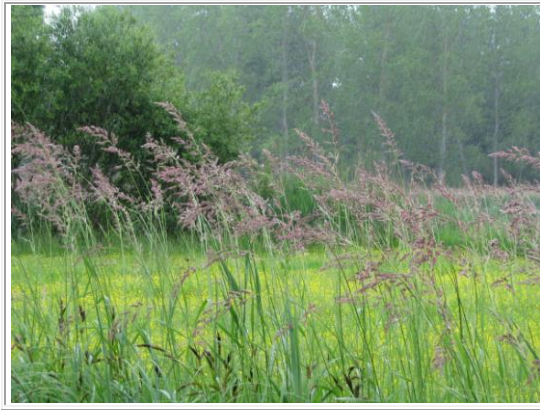
Joncs en fleur