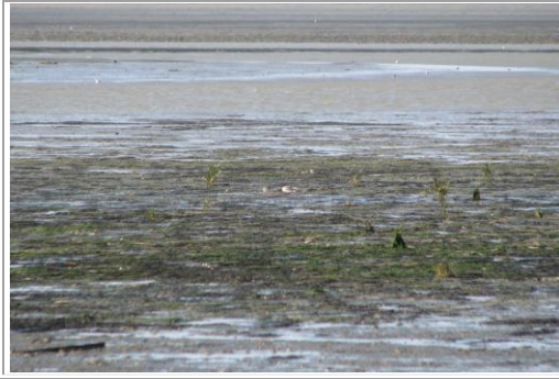
Tadornes de Belon