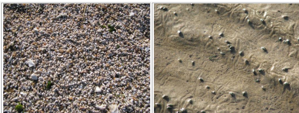
coquilles d' Hydrobies

Bonne Anse est un lieu d'accueil pour tous les oiseaux, la nourriture y est abondante, variée; l'étendue de la baie avec sa faible profondeur permet à chacun de trouver la place et le type de nourriture recherchés : coquillages minuscules Hydrobies, vers, pour les Limicoles (huîtres, bécasseaux), herbiers, végétaux pour les autres (Bernaches cravant, tadornes de belon). On y trouve également hérons, aigrettes friands de petits poissons , crevettes, coquillages et crustacés.